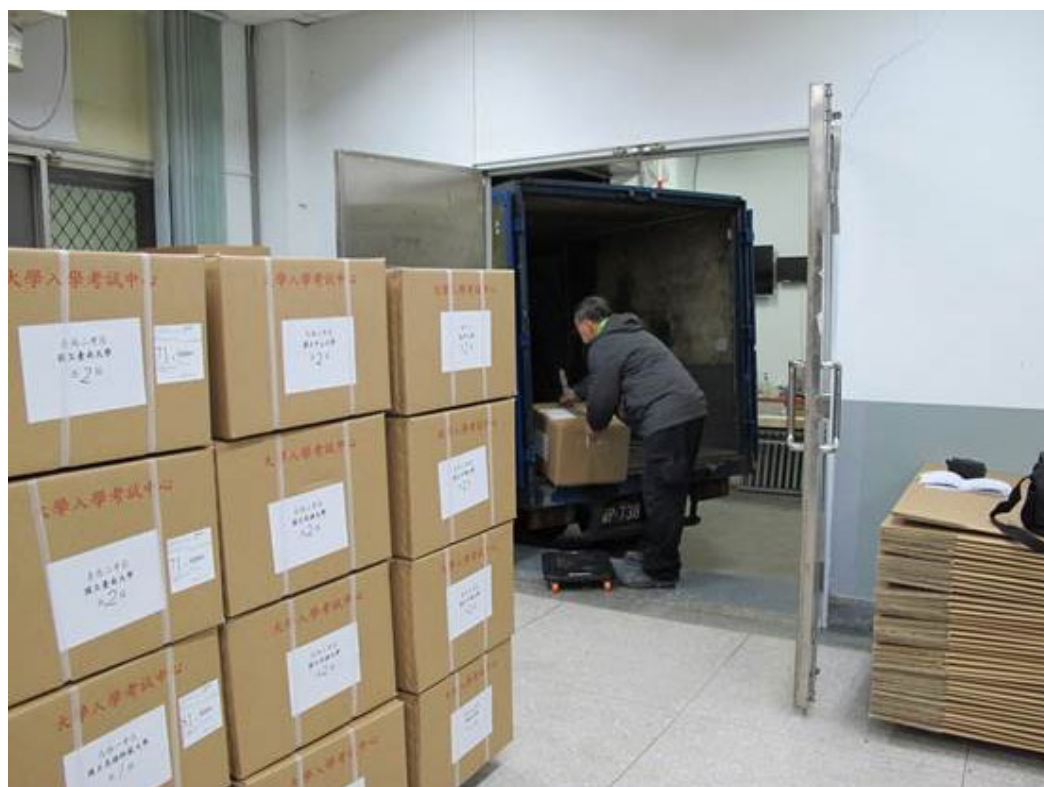
104年12月4日寄送105學年度高中英語聽力測驗第二次考試考區物資情形。