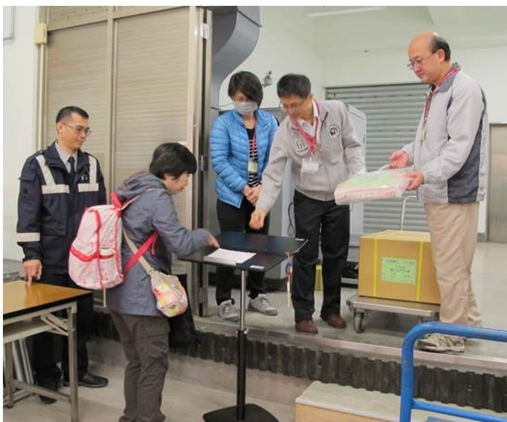
104年12月10日運送105學年度高中英語聽力測驗第二次考試之試題、卡至金門、澎湖、馬祖考區。