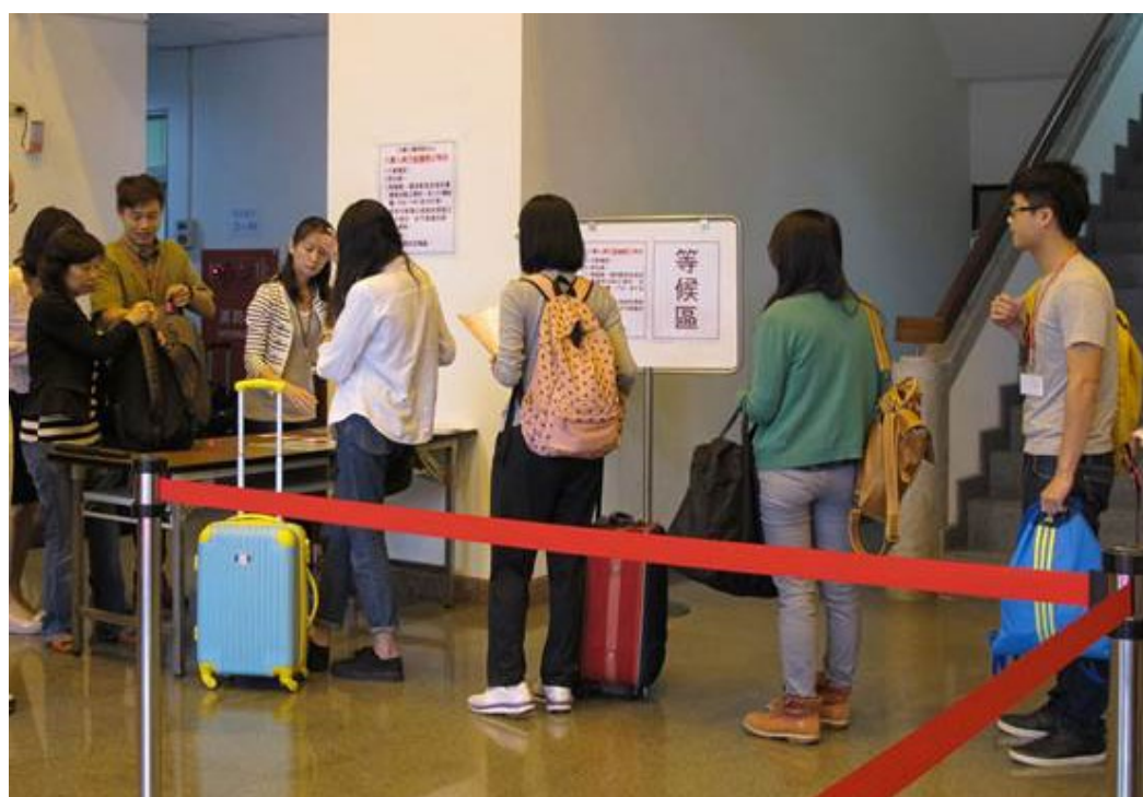
104學年度高中英語聽力測驗第一次考試於103年10月25日進行第一梯次入闈，圖為入闈前檢查攜入闈場物品情形。