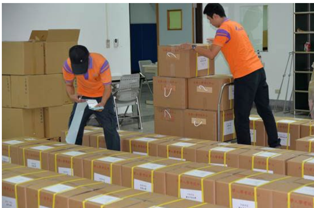
103年10月14日寄發104學年度高中英語聽力測驗第一次考試場務資料情形。