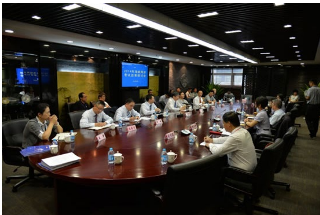
照片為2014海峽兩岸考試改革研討會會議進行情形。

透過此次研討會與參訪交流，可見兩岸對大學招生制度、入學考試內容，以及考務技術的發展與改革有相當類似的觀點與設計，特別是招考的公正公平，是最核心的議題，而對於不希望入學考試成為影響高中教學的指揮棒，也有相同的思維。藉由每年雙方深入的專業交流，相互借鏡或合作，對於促進兩岸考試中心的專業發展有相當助益，今年，一樣有著滿滿的收穫。9月17日，在依依不捨的道別與明年再見的殷殷邀請聲中，為此次為期8天的參訪活動，劃下完美句點！