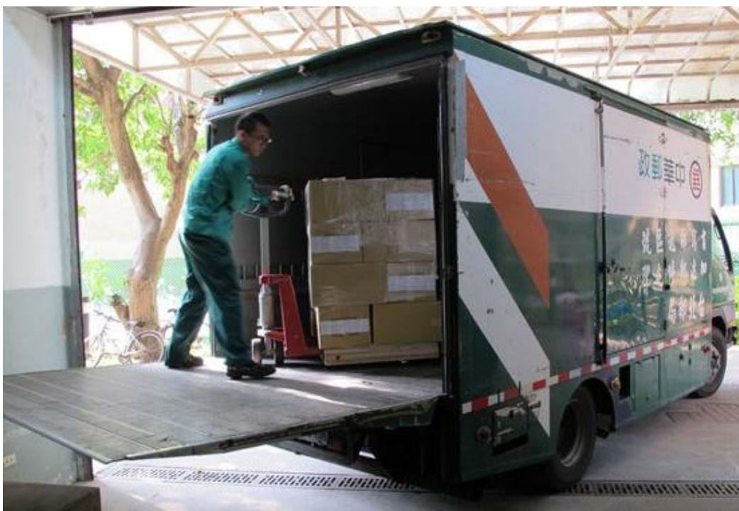
103年10月15日郵寄104學年度高中英語聽力測驗第一次考試准考證情形。