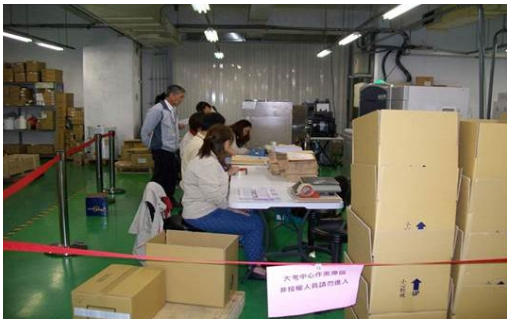
103年10月14日印製104學年度高中英語聽力測驗第一次考試准考證情形。