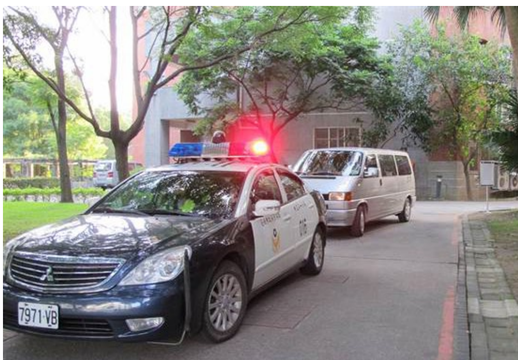
103年7月1日~3日警車護送103學年度指定科目考試台北地區試題、卷、卡至 各分區。