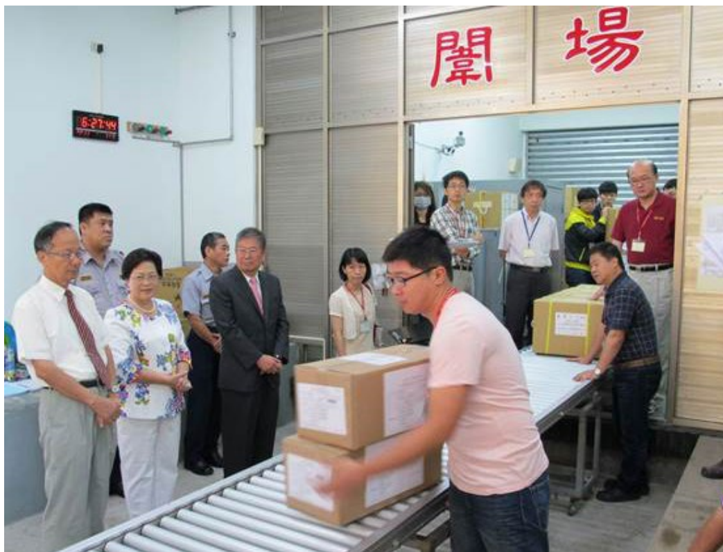
103學年度指定科目考試台北地區各考區之試題、卷、卡於考試當日 (7月1日~3日)由考區派專人至本中心領取。