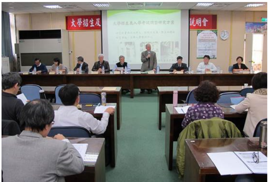
「大學招生及入學考試調整研究方案」全國分區說明會北二區場於103年3月17日假新竹高中召開，說明會由中央研究院劉院士兆漢（前排右四）主持。