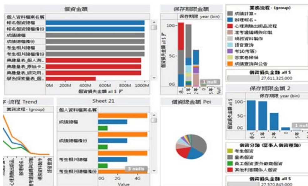
圖一、風險監控系統 (Dashboard)

本次雙標準的驗證稽核均在線上進行。主導稽核員在大考中心的iSCE (IT Service and Security Enabling Capacity)資安表單系統上進行文件調閱、比對與營運紀錄查核。iSEC整合資訊基礎架構ITIL(Information Technical Infrastructure library)、ISO 27001及BS 10012，將作業流程及管理審核融合於合規(Compliance)要求之中，增加執行與管理的效率。在iSEC 系統中更可以追蹤作業執行狀態、作業流程中的關卡及審核過程。各項作業情況可彙整於風險管理系統的儀表板(Dashboard)中進行監管。