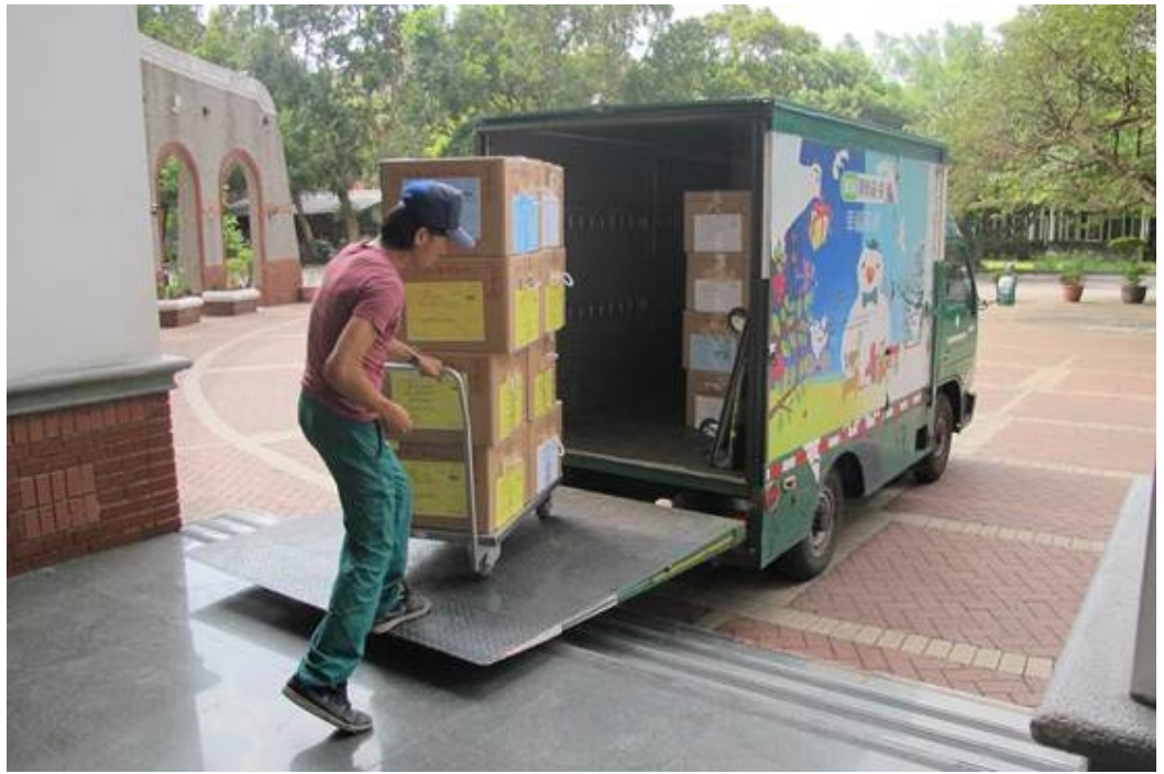
103學年度高中英語聽力測驗集報手冊於102年8月5日由郵局人員專車載至郵局寄送。