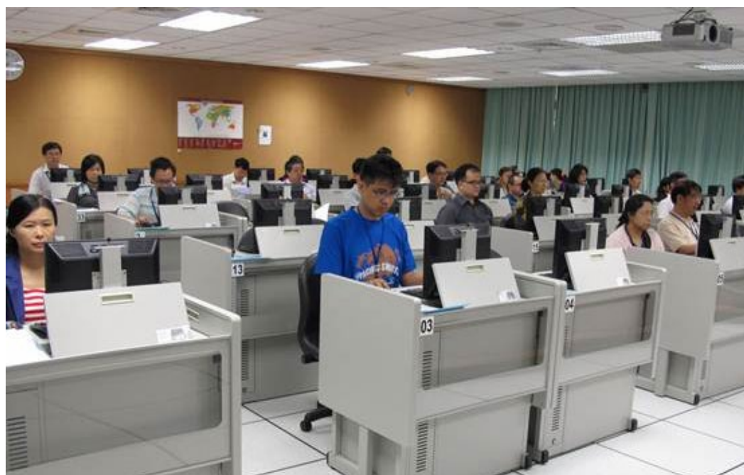
102學年度指定科目考試螢幕閱卷情形。(民國102年7月10日)