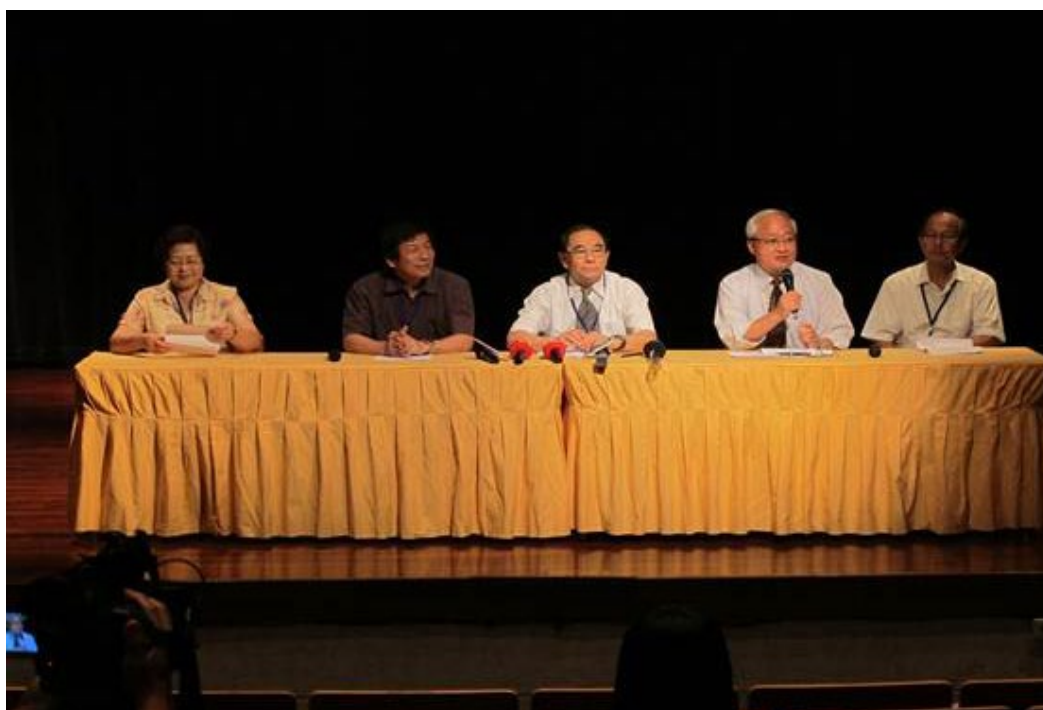
102學年度學指定科目考試國文、英文非選擇題評分原則記者說明會於102年7月10日上午10時假臺灣大學視聽教育館舉行，由牟主任宗燦主持，國文科閱卷召集人逢甲大學中文系謝教授海平、英文科閱卷召集人中國文化大學外國語文學院張院長武昌向媒體說明各大題評閱重點。（左一起：洪副主任冬桂、張院長武昌、牟主任宗燦、謝教授海平、沈副主任青嵩）