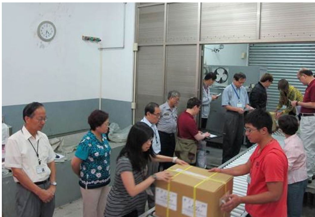
102學年度指定科目考試試題、卷、卡，於民國102年6月30日分批運送至北、中、南、東等考區。