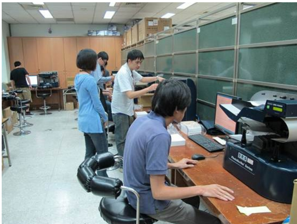
102學年度指定科目考試空白答案卡掃描查驗作業情形。