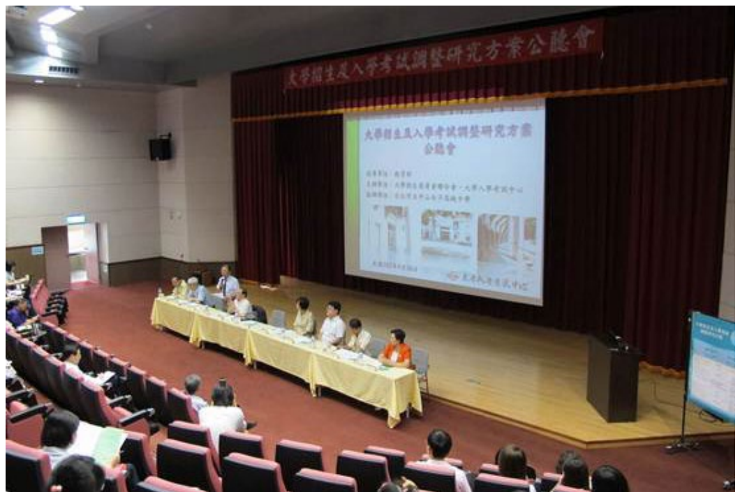
民國102年5月26日(上午)「大學招生及入學考試調整研究方案」北區公聽會，假台北市立中山女子高級中學舉行。