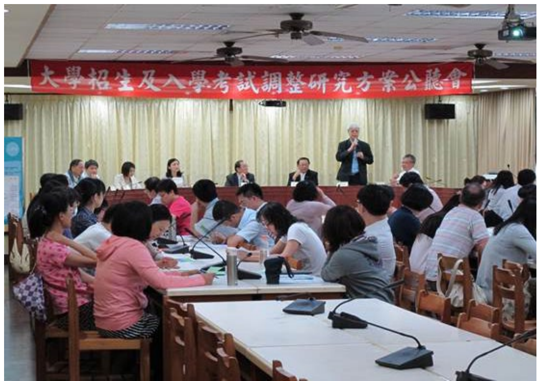
民國102年5月18日上午「大學招生及入學考試調整研究方案」中區公聽會，假國立臺中文華高級中學舉行。