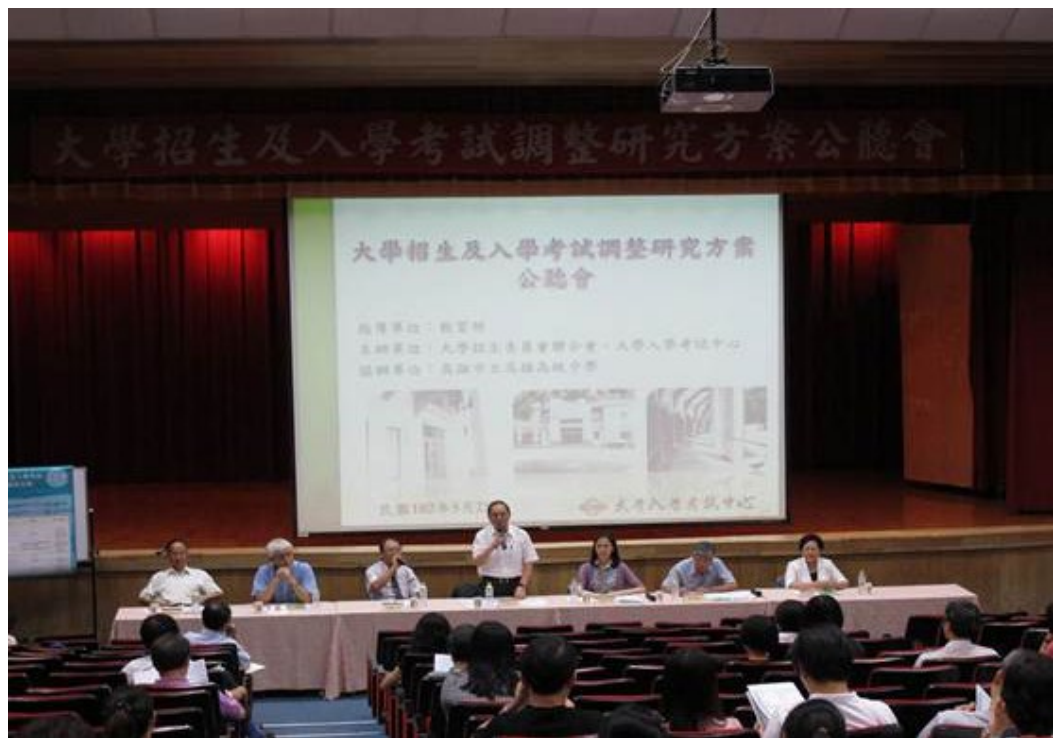
民國102年5月25日(下午)「大學招生及入學考試調整研究方案」南區公聽會，假高雄市立高雄高級中學舉行。