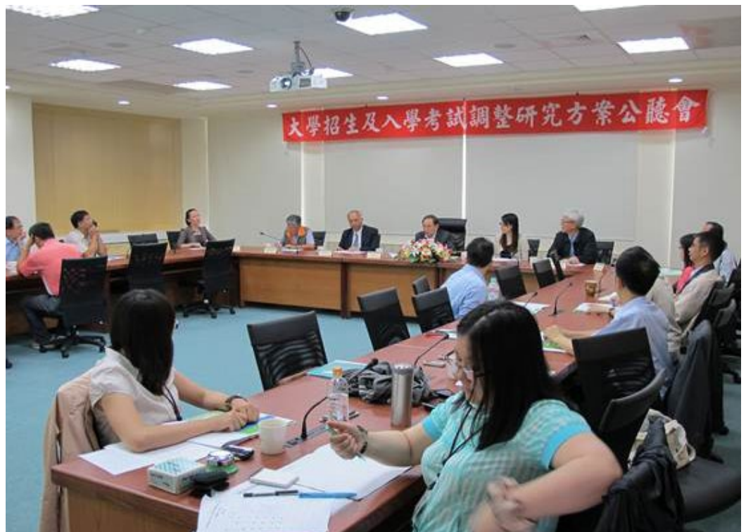
民國102年5月19日(下午)「大學招生及入學考試調整研究方案」東區公聽會，假國立花蓮女子高級中學舉行。