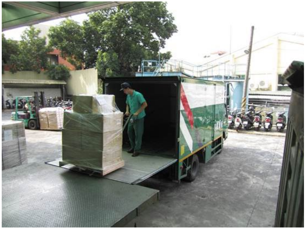
102學年度指定科目考試准考證於民國102年6月3日由郵局人員專車載至郵局。