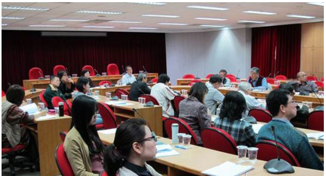
「大學招生及入學考試調整研究方案」招生子計畫專家諮詢座談會於民國102年4月9日假本中心第一會議室召開，由靜宜大學唐校長傳義主持。