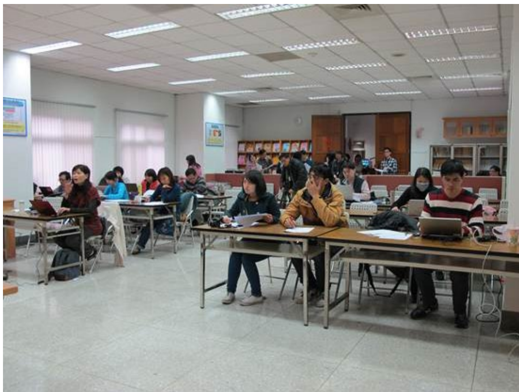
102學年度學科能力測驗成績相關統計資料說明會。