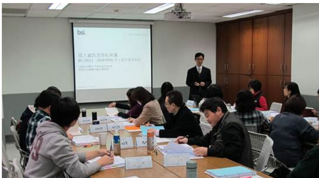
本中心於民國102年2月22日舉辦「PIMS個人資訊管理系統主導稽核員」教育訓練課程。