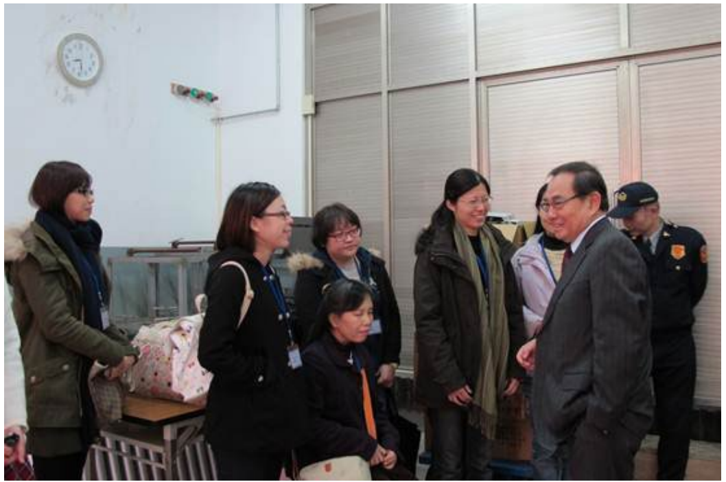
102學年度學科能力測驗點字卷及語音試題製作人員於民國102年01月21日入闈。