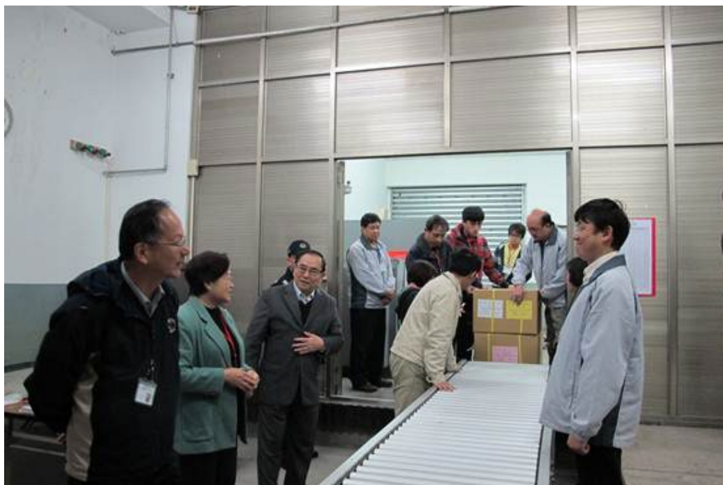
102學年度學科能力測驗試題、卷、卡，於民國102年1月25日分別運送至金門、馬祖、澎湖等考區。