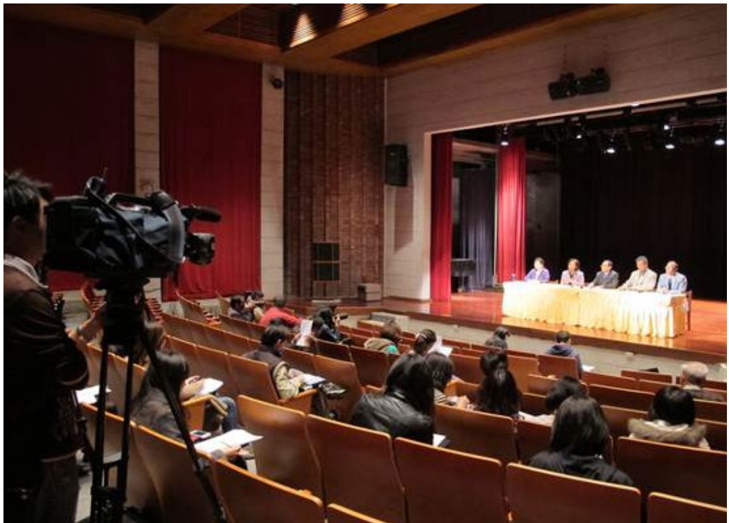
102學年度學科能力測驗國文、英文非選擇題評分原則記者說明會於2月2日上午10時假臺灣大學視聽教育館小劇場舉行，由牟主任宗燦（中）主持，洪副主任冬桂（左一）、沈副主任青嵩（右一）、國文科閱卷召集人台灣大學中文系蕭教授麗華（左二）、英文科閱卷召集人台北大學英文系劉教授慶剛（右二）向媒體說明各大題評閱重點及釋疑。