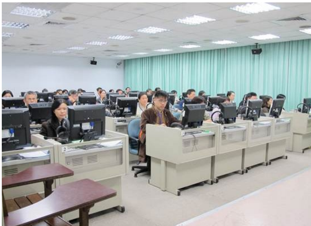
102學年度學科能力測驗國文科非選擇題螢幕閱卷情形。