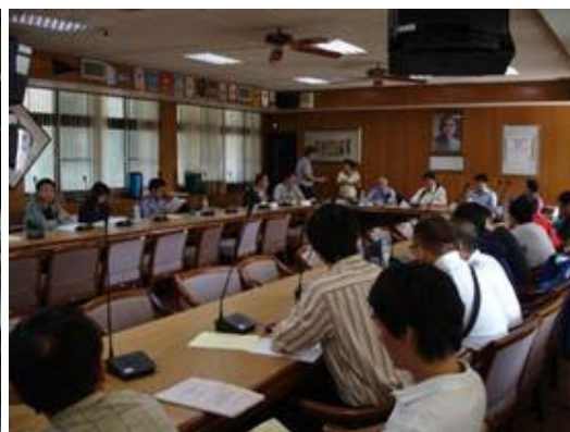
物理科命題技術研習會(臺中一中)