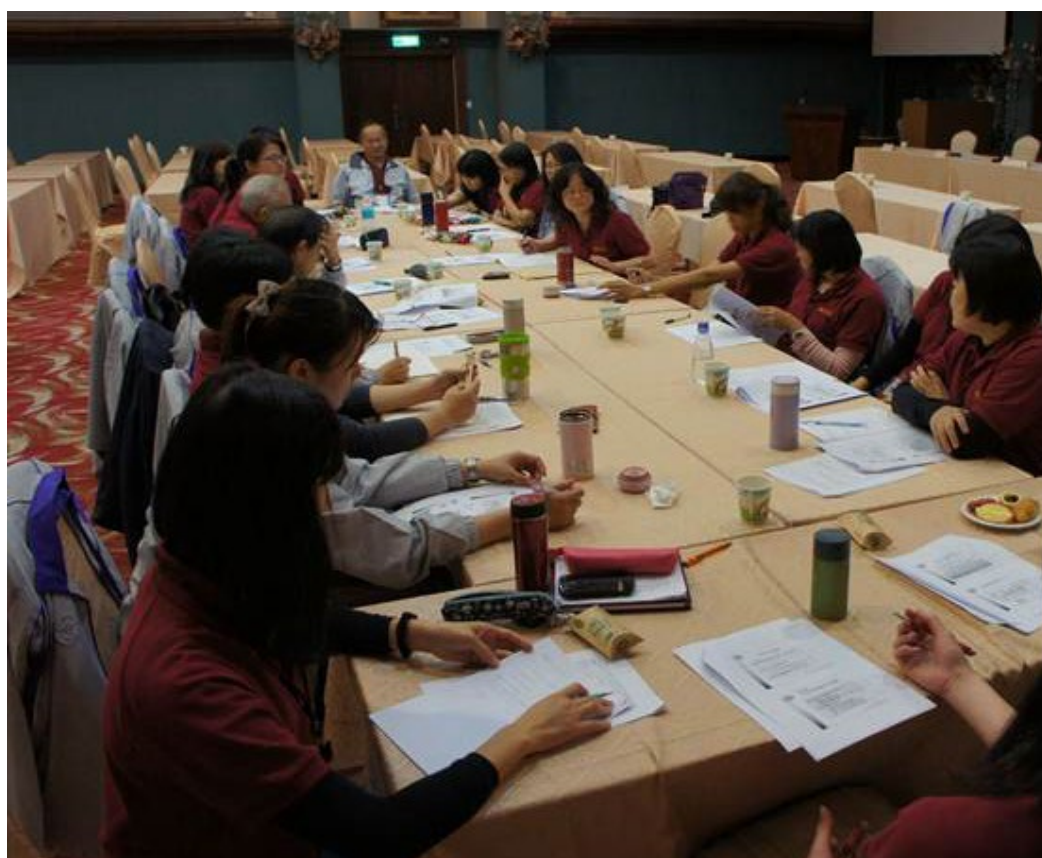
各處分組座談--第一處。