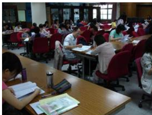
國文科命題技術研習會(新興高中)

中南部場命題研習會的議程安排，大抵和北部場相同。首先是由學者專家講授各種題型的命題與修題技巧，其後以分組的形式直接進行實作修題，俾使高中教師深刻體會命題、修題的方法，並充分闡述己見。在分組實作結束後，各組依序發表組內修題討論的意見與結果，並提出相關感想和建議。在會議結束前，由各科學科研究員說明題庫徵題相關事項，期望高中教師能發揮所長，積極參與本中心的徵題活動。