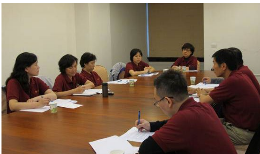
各處分組座談--第三處