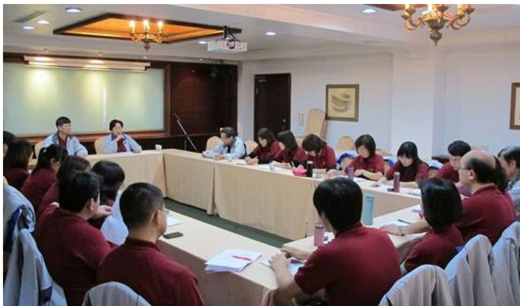
各處分組座談-- 第二處。