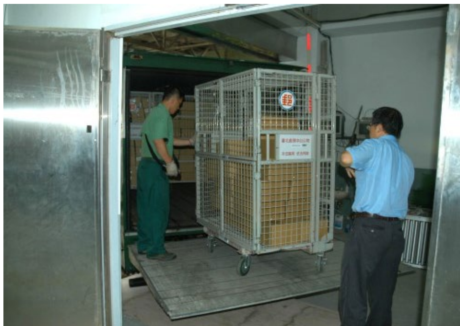
99學年度指定科目考試准考證已於6月3日由郵局派郵車及專人收件，集報單位採快捷方式，個別報名考生採限時掛號方式，寄送至各報名單位及個報考生。