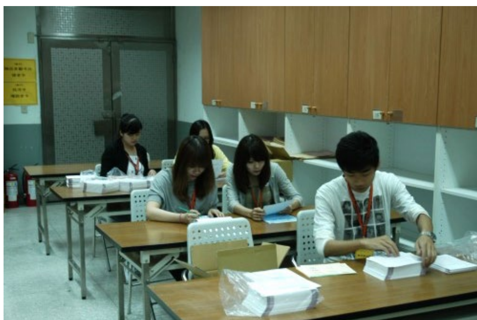
99學年度指定科目考試答案卡製卡作業情形。