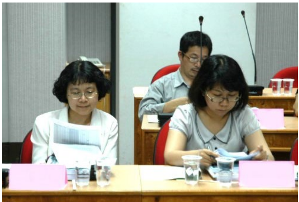
身心障礙相關領域專家、學者參加99學年度指定科目考試身心障礙考生應考服務審查會議，討論本年度各身心障礙考生應考服務項目情形。