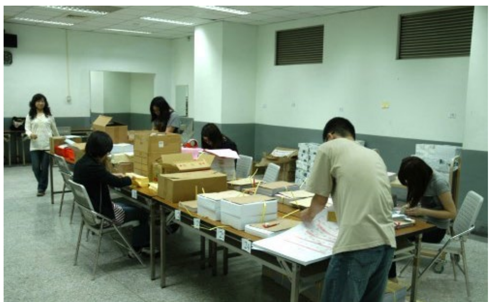
99學年度指定科目考試場務表件作業情形。