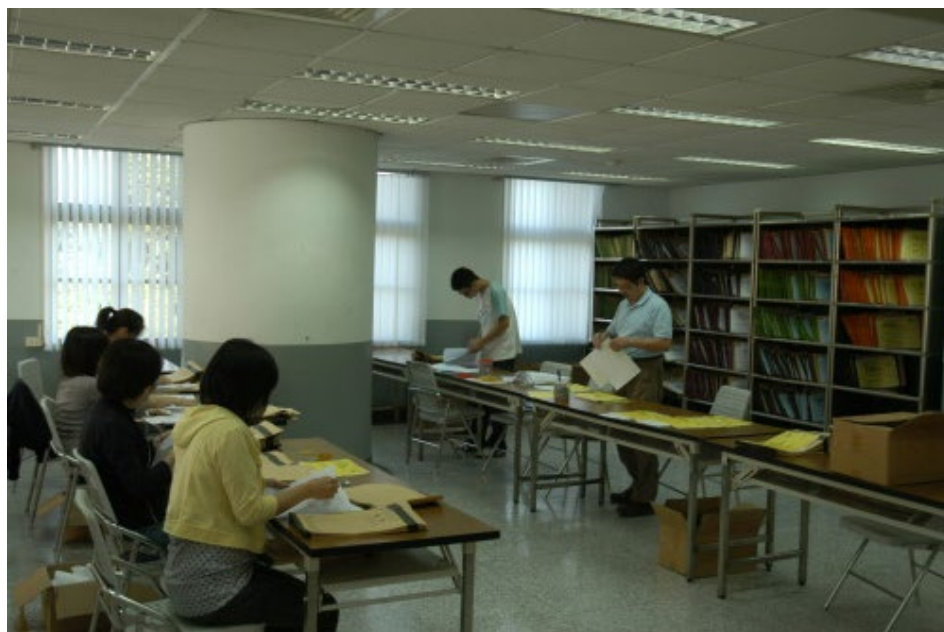
99學年度指定科目考試答案卷製卷作業情形。