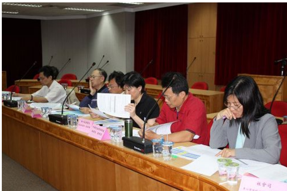
97指定科目考試身障生審查會議於97年5月20日假本中心第一會議室舉行，照片中為本學年度之身障生審查委員。