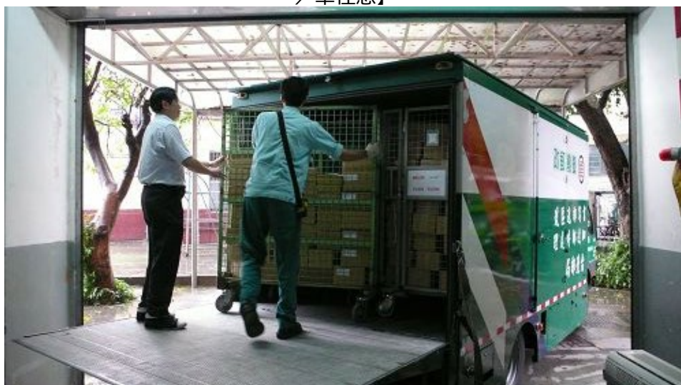
97指定科目考試准考證已於6月3日寄送各報名單位及個人。集報單位採快捷方式，個報採限時掛號方式。大型郵車收件後，以專案處理方式送回總局快速分送。