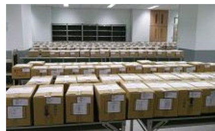
※ 准考證印製查驗與裝箱作業

本學年度參加指定科目考試人數，經扣除放棄考試申請退費考生 9,262 人後，總計考生人數為 93,681 人，歷年詳細報名人數請見下表。本次放棄考試申請退費的考生，較上學年度 9,480 人略為減少 218 人，考生數則較上學年度 100,117 人減少 6,436 人。准考證已於 6 月 3 日寄發，集體報名申請退費考生的支票亦隨同准考證寄發，個別報名考生之退費支票則於 6 月 6 日寄發至考生個人通訊地址。